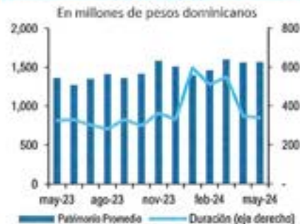
Gráfico elaborado por Feller Rate en base a información provista por la Administradora.

Al cierre de mayo de 2024 el Fondo no cumplía con los límites reglamentarios por tipo de instrumento. A ese cierre contable, la exposición en certificados financieros alcanzaba sólo un 12,3% de la cartera (mínimo reglamentario es 60%), en tanto que la inversión en fondos llegaba al 59,7% (máximo reglamentario es 40%).